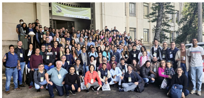
Foto com os participantes da 68ª RBras na frente do Pavilhão de Engenharia da ESALQ/USP, em Piracicaba.

A 68ª Reunião Anual da Região Brasileira da Sociedade Internacional de Biometria (RBras) foi realizada na cidade de Piracicaba, Estado de São Paulo, entre os dias 29 e 31 de maio de 2024. A organização do evento esteve a cargo da Região Brasileira da Sociedade Internacional de Biometria (RBras) e do Departamento de Ciências Exatas, da Escola Superior de Agricultura "Luiz de Queiroz" da Universidade de São Paulo (LCE-ESALQ/USP), sob coordenação do professor Idemauro Antonio Rodrigues de Lara.